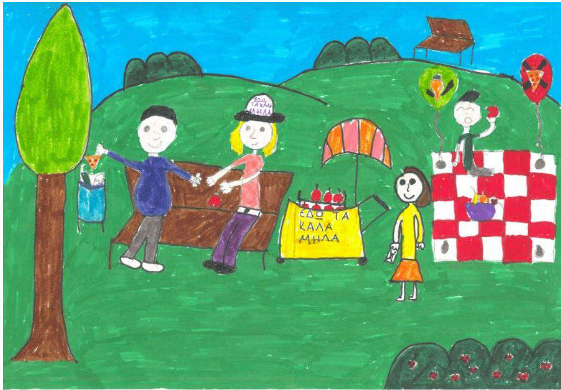
2 ο Βραβείο στην κατηγορία Α' - Γ' Δημοτικού, Δημοτικό Ελληνογαλλικής Σχολής Ουρσουλινών