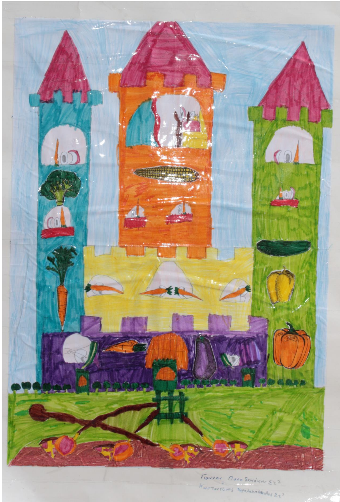
3 ο Βραβείο στην κατηγορία Δ' - ΣΤ' Δημοτικού, 4 ο Δημοτικό Σχολείο Αμαρουσίου (Ζεκάκειο)