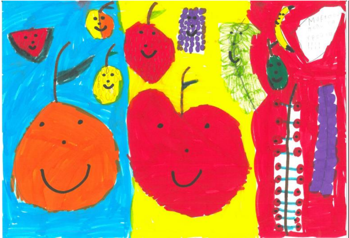
3 ο Βραβείο στην κατηγορία Α'- Γ' Δημοτικού, Δημοτικό Ελληνογαλλικής Σχολής Ουρσουλινών