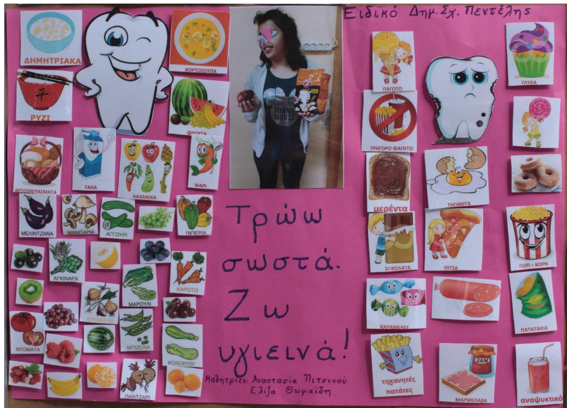
1 ο Βραβείο στην κατηγορία Δ' - ΣΤ' Δημοτικού, 1 ο Ειδικό Δημοτικό Σχολείο Πεντέλης