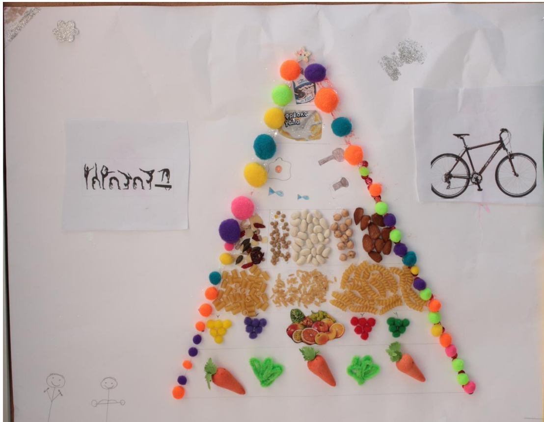
3 ο Βραβείο στην κατηγορία Δ' - ΣΤ' Δημοτικού, 1 ο Δημοτικό Σχολείο Νέας Πεντέλης