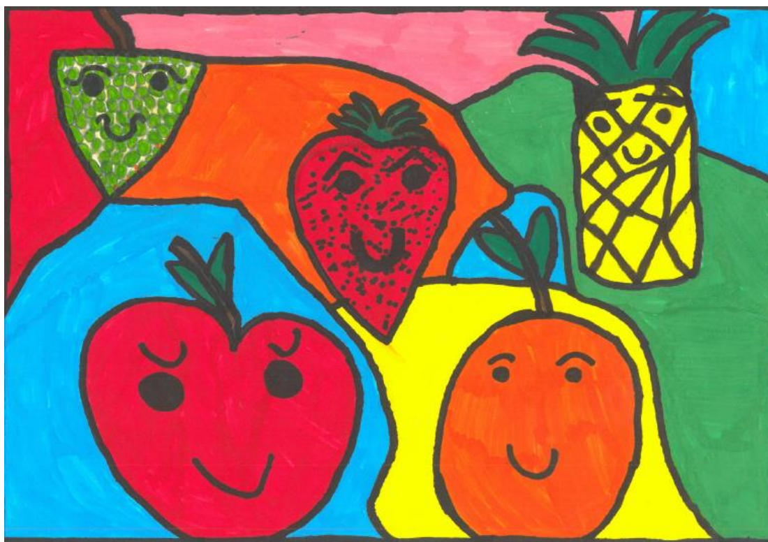
2 ο Βραβείο στην κατηγορία Α'- Γ' Δημοτικού, Δημοτικό Ελληνογαλλικής Σχολής Ουρσουλινών