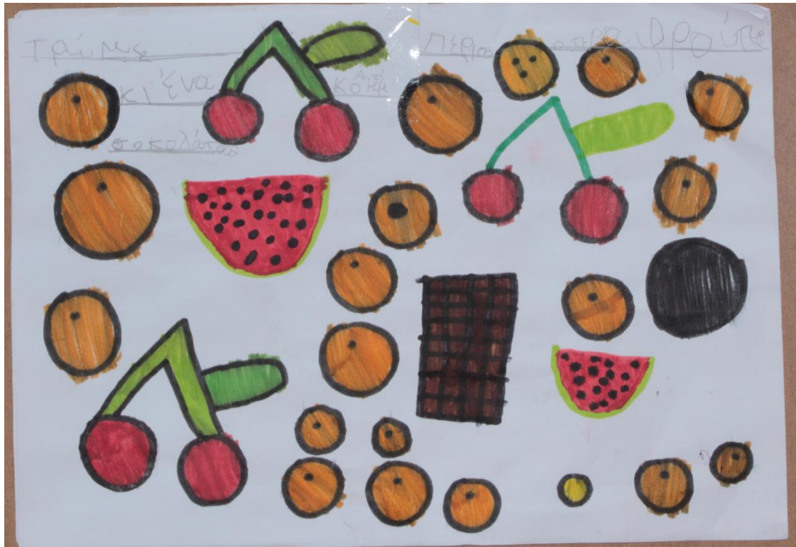
3 ο Βραβείο στην κατηγορία Α' - Γ' Δημοτικού, 1 ο Ειδικό Σχολείο Αμαρουσίου (Σικιαρίδειο)