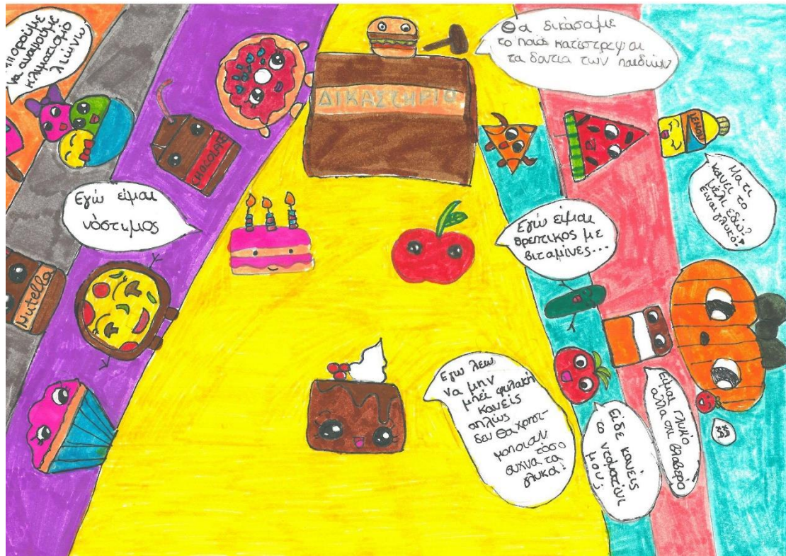
2 ο Βραβείο στην κατηγορία Α'- Γ' Δημοτικού, Δημοτικό Ελληνογαλλικής Σχολής Ουρσουλινών