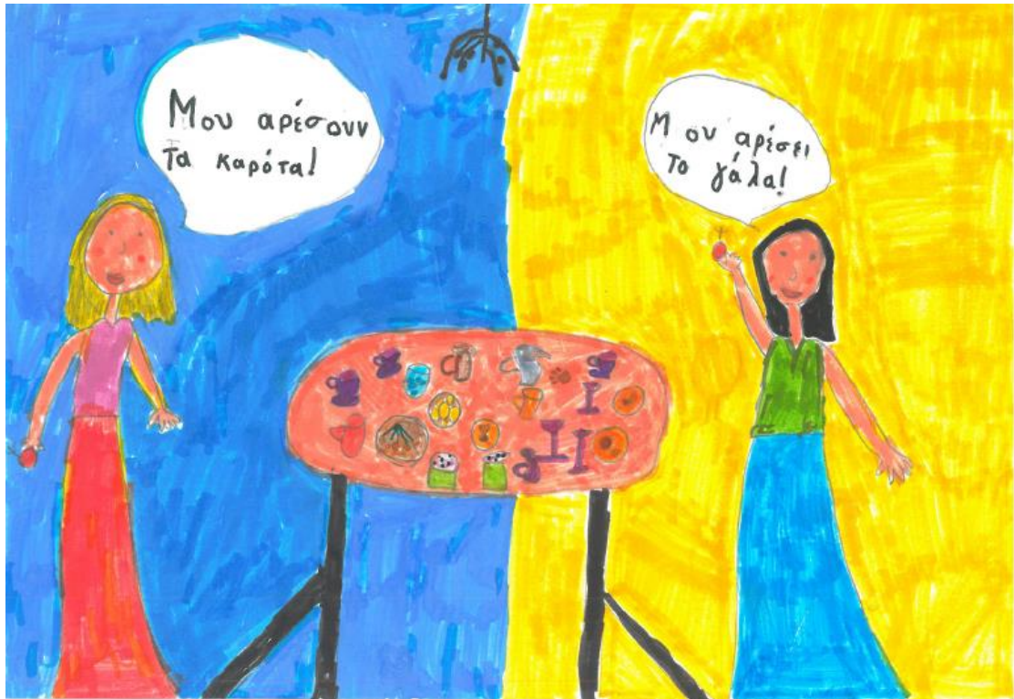
2 ο Βραβείο στην κατηγορία Α' - Γ' Δημοτικού, Δημοτικό Ελληνογαλλικής Σχολής Ουρσουλινών